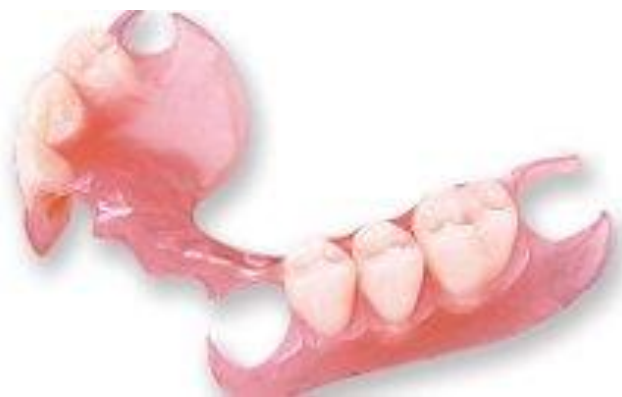
PROTESIS PARCIALES RIGIDAS Y FLEXIBLES

Prótesis parciales : Las prótesis parciales no se encuentran fijas permanentemente en la boca. Pueden ser retiradas de la boca, ya que se sujetan a dientes adyacentes mediante ganchos y en el caso de pacientes que hayan perdido la totalidad de las piezas, las prótesis pueden ser soportadas por la propia mucosa.