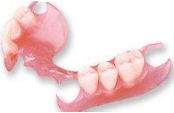
PROTESIS PARCIALES RIGIDAS Y FLEXIBLES

Prótesis parciales : Las prótesis parciales no se encuentran fijas permanentemente en la boca. Pueden ser retiradas de la boca, ya que se sujetan a dientes adyacentes mediante ganchos y en el caso de pacientes que hayan perdido la totalidad de las piezas, las prótesis pueden ser soportadas por la propia mucosa.